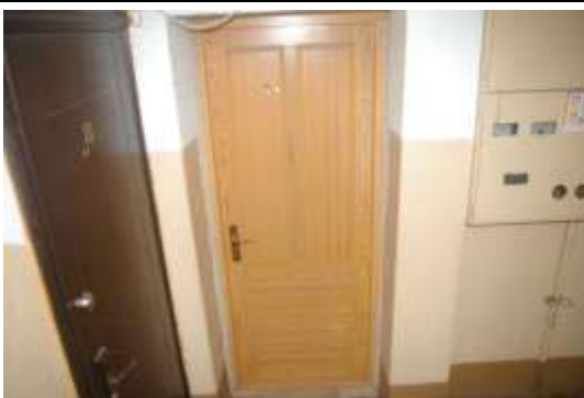
Dzīvojamā ēka ar kadastra apzīmējumu 6468 003 0046 001, dzīvoklis Nr.14