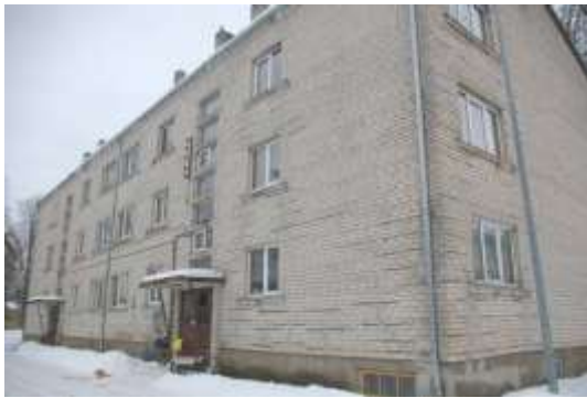
Dzīvojamā ēka ar kadastra apzīmējumu 6468 003 0046 001