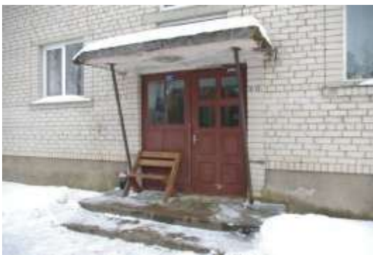
Dzīvojamā ēka ar kadastra apzīmējumu 6468 003 0046 001