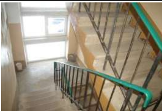
Dzīvojamā ēka ar kadastra apzīmējumu 6468 003 0046 001, koplietošanas telpa